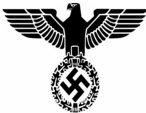
Слика 3.-Нацистички орао

Тражила се јака централна власт државе Рајха.