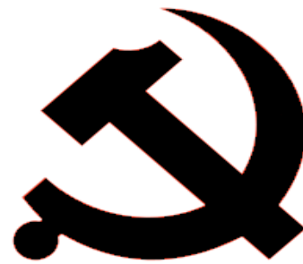
Слика 4.-Грб комунизма

У циљу дистинкције (разликовања) комунизма од осталих видова социјализма, 1918. године партија мења име у Комунистичка партија чиме је по први пут повучена јасна гранична линија између комунизма и осталих видова социјализма.